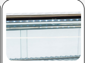
Luce LED interna