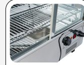
Basamento in acciaio inox