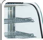
Doppio vetro anti-dispersione